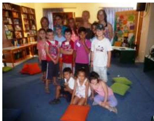
Περισσότερες φωτογραφίες από τις εκδηλώσεις « Οδύσσεια, η πολυμήχανη ιστορία » στις συλλογές της Βιβλιοθήκης Λιβαδειάς στο Picasaweb http://goo.gl/E9h0g & http://goo.gl/6HZsv