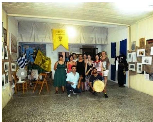
Περισσότερες φωτογραφίες από την εκδήλωση « Οι δικοί μας Πόντιοι » στη συλλογή της Βιβλιοθήκης Λιβαδειάς στο Picasaweb http://goo.gl/r3hWg