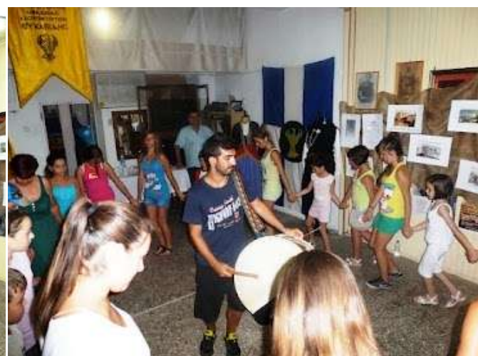
Βίντεο από την εκδήλωση « Οι δικοί μας Πόντιοι » http://youtu.be/_j68Pm2P8KM